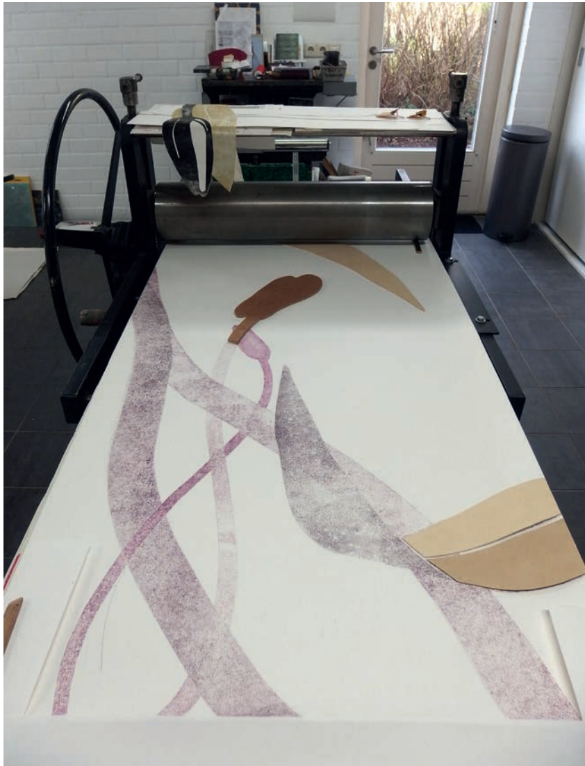
Every which way formaat / size: 70 x 162 cm oplage / edition of : 1