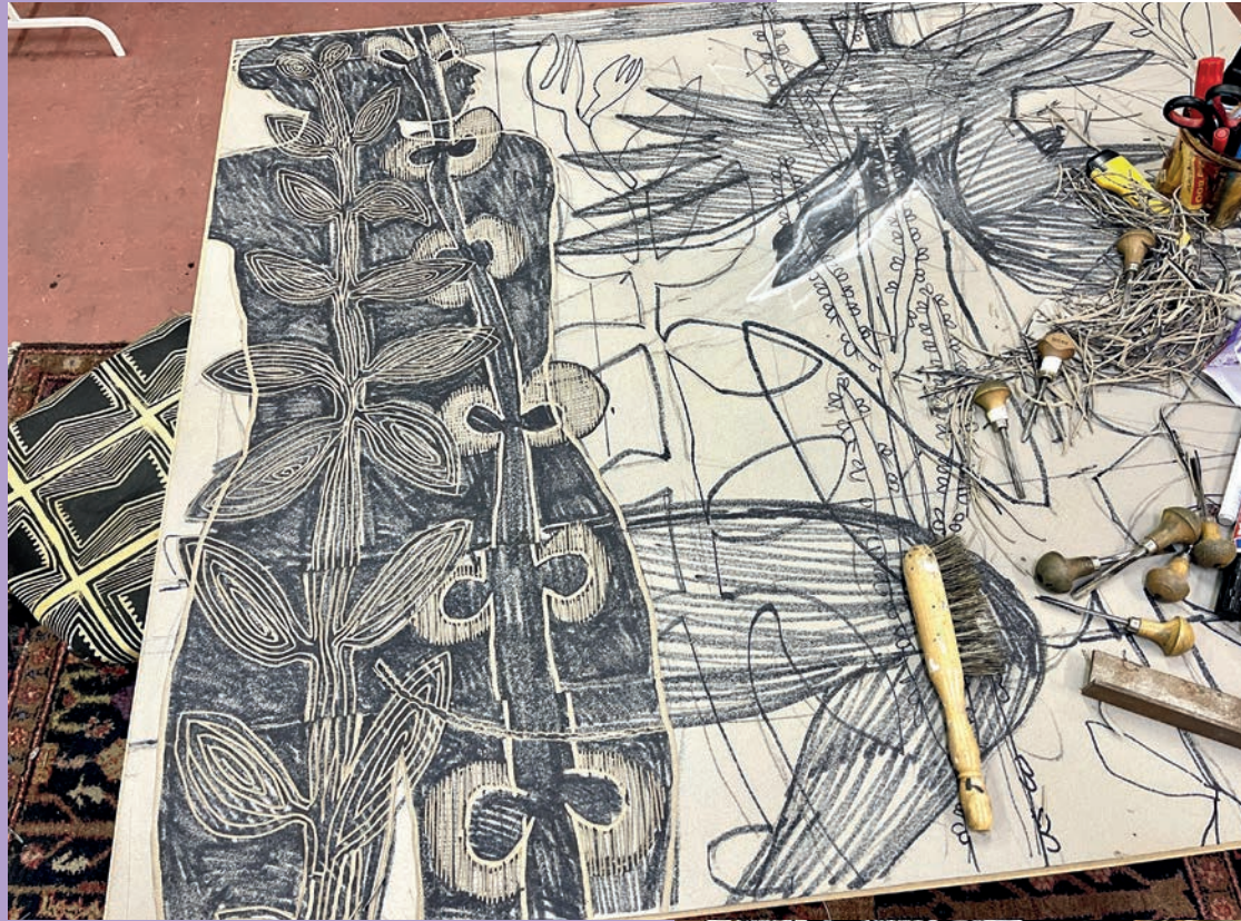
El Camino formaat / size: 130 x 110 cm oplage / edition of: 3