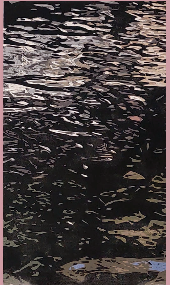
Weerspiegeling / Reflection formaat / size: (3 x) 61 x 107 cm oplage / edition of: 3